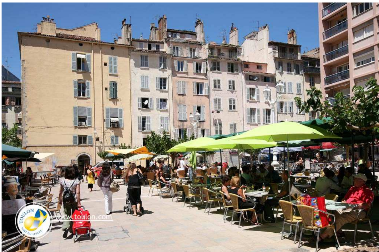
Photo : Toulon, une ZFU atypique couvrant le centre historique et des friches industrielles de centre ville situées à proximité immédiate du Pôle d'échanges multimodal de la gare de Toulon-centre et du port.

Ce cercle vertueux se confirme sur le centre ville de Toulon où se sont installées les TPE dans divers domaines : services aux entreprises, services à la personne, services des entreprises de l'internet. Ces nouveaux arrivants ont permis une diversification des commerces avec une montée en gamme : des enseignes commerciales réputées se sont récemment installées (Zara, Nespresso, Guess...).